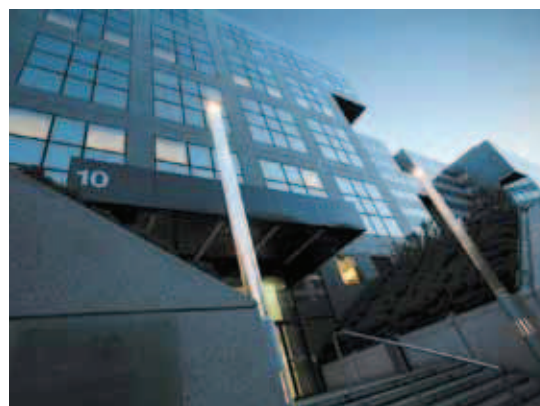
Charenton - 94