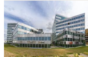
Berlingot Nantes 15 000m 2 De Bureaux