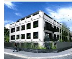
Asnières sur Seine 8 328 m 2 Résidentiel