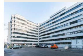
MQM3 Vienne 25 355 m 2 Bureaux