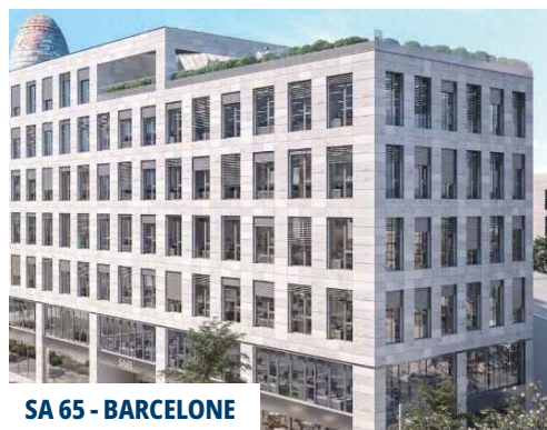
SA 65 - BARCELONE