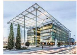
El Portico Madrid 21 000 m 2 de Bureaux