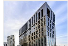
Enjoy Paris 17° 16970 m 2 de Bureaux et Commerces