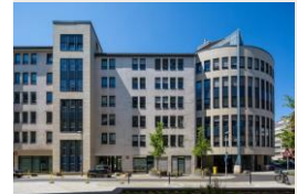
BBW Frankfurt 34 943 m 2 Bureaux et Résidentiel