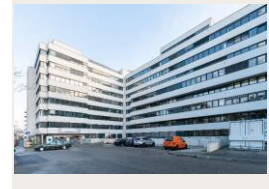
MQM3 Vienne 25 355 m 2 Bureaux